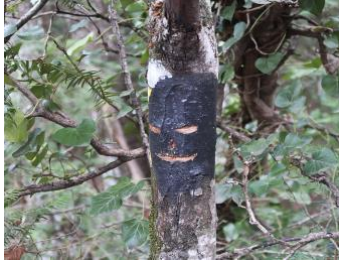
Zorro : la première d'une longue série de marques noires qui va indiquer la voie Gombault sur tout son développement.

Du point 767 m, suivre pendant une dizaine de minutes le sentier Merveilleux qui se met à monter et repérer sur un arbre une marque noire (photo ci-dessous) au début d'une sente bien visible (la seule rencontrée de toute façon) qui part à droite.