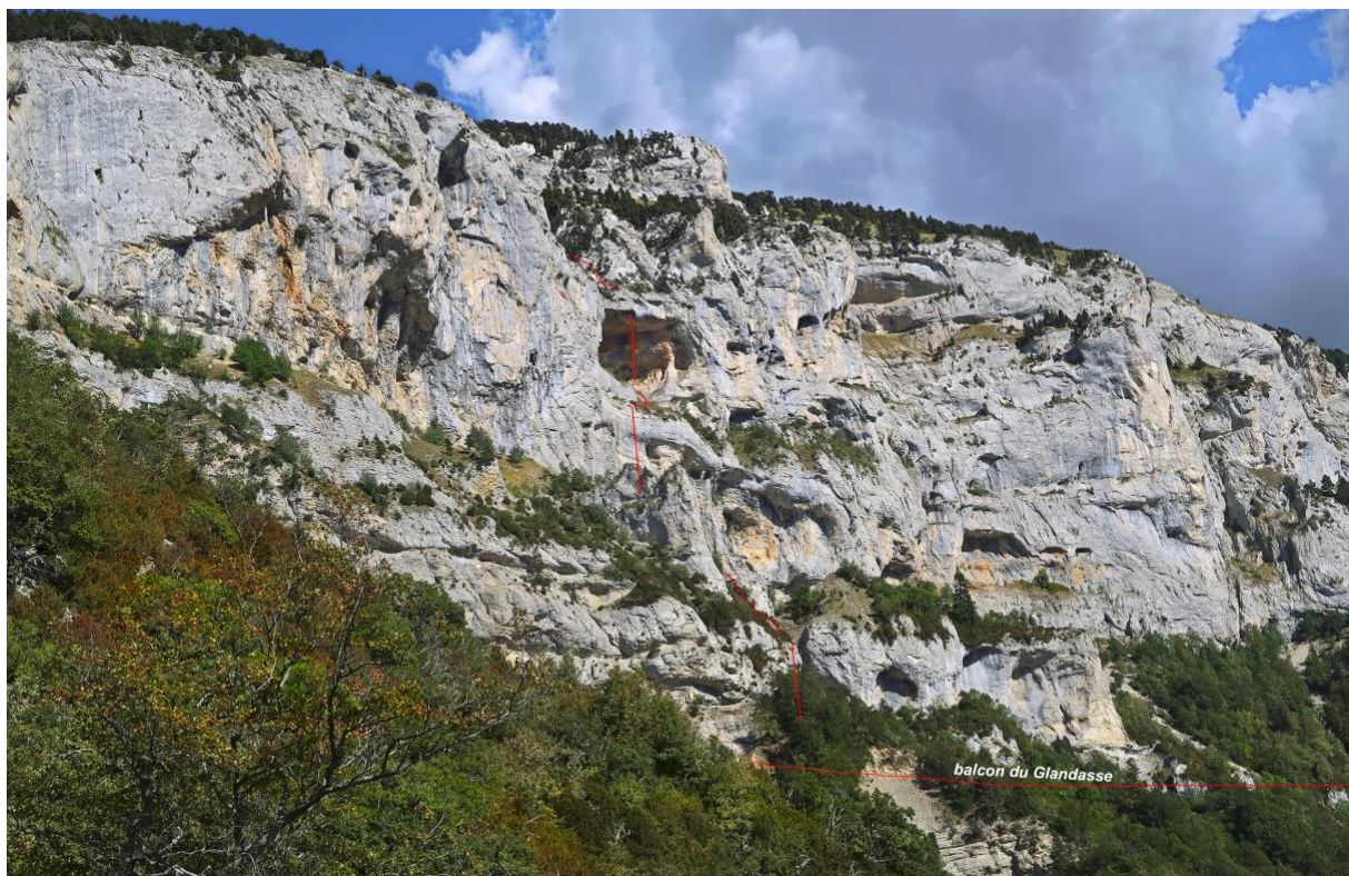
La Baume Rouge telle qu'on la voit depuis le sentier de l'approche.