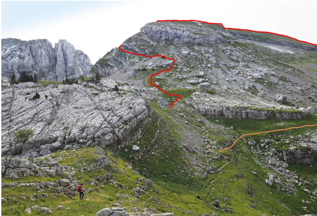
La cuvette du Clot-d'Aspres où serpente le chemin du pas de l'Œille. À droite en orange part le sentier qui va jusqu'au col des Deux-Sœurs et par lequel on reviendra. En rouge, la montée détournée qui permet d'atteindre le début de l'arête vers le sommet 2060 m (à droite), sous lequel se trouve le scialet aux arches multiples.

Carte IGN Top 25 : 3236 OT (Villard-de-Lans). Voir tracé sur carte en page 3.