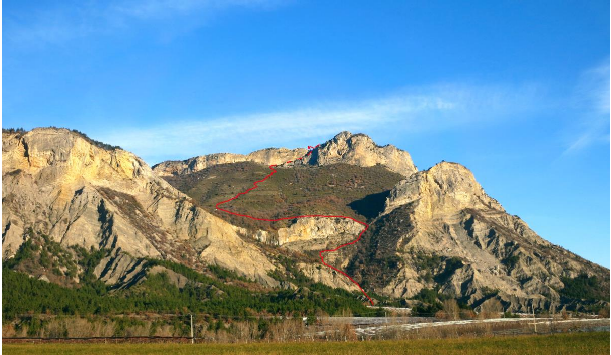
Le pic de Crigne et la rampe diagonale qui y mène depuis la bergerie ruinée de Basse-Crigne.