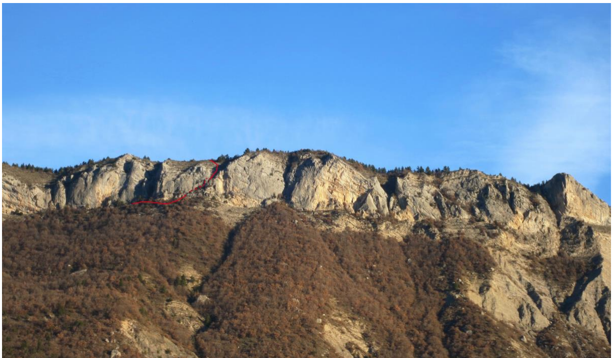
Le passage que nous avons inauguré dans la falaise de Ventavon. Un moyen d'éviter le retour par la route plus bas dans la vallée.