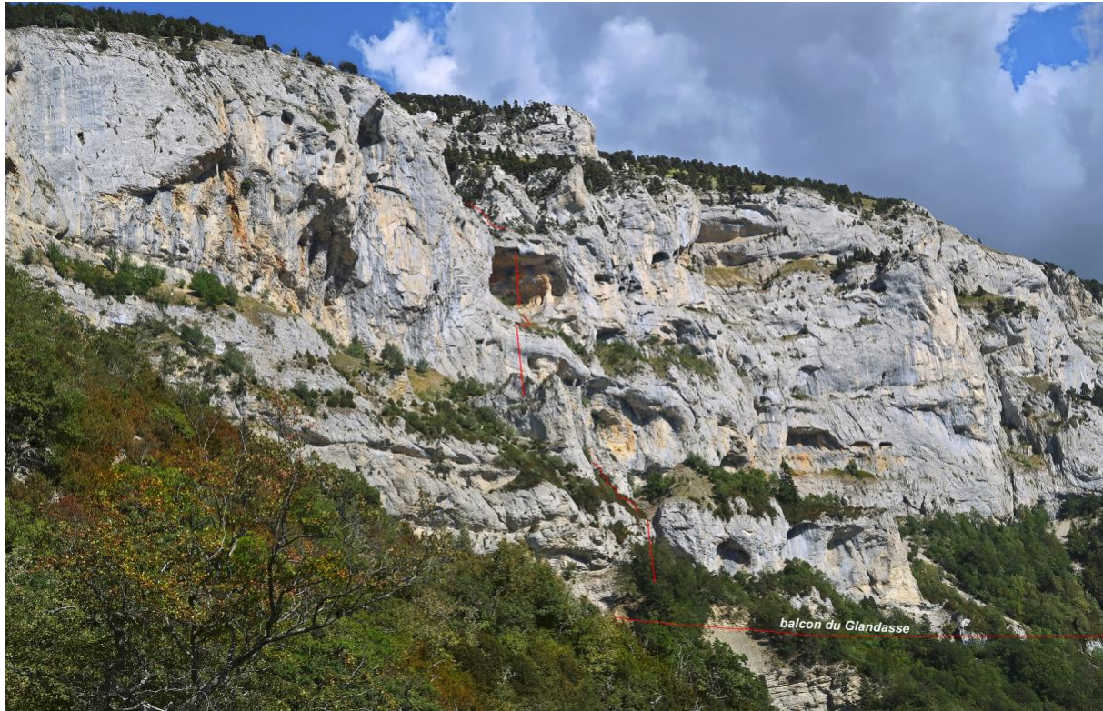
La Baume Rouge telle qu'on la voit depuis le sentier de l'approche.