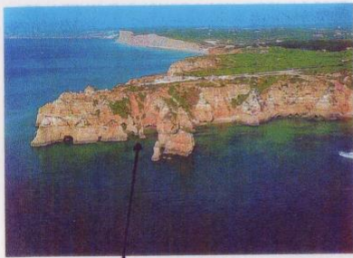
PONTA DA PIEDADE CREEK