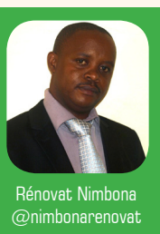
Rénovat Nimbona @nimbonarenovat