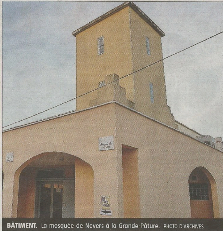
BÂTIMENT. La mosquée de Nevers à la Grande-Pâtüre.

Tous les ans aux mois de mars et novembre, des rencontres islamo chrétiennes, ouvertes à tous et à toutes, croyants et non croyants, sont organisées en France et dans d'autres pays d'Europe. « Le but est d'apprendre à se connaître et d'accepter que l'autre ait des croyances différentes. Ce qui est important est de garder le contact, de continuer à se parler et de partager un moment de paix dans le res-