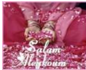
Nous savons dire «bonjour» en arabe