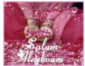
Nous savons dire «bonjour» en arabe

https://www.youtube.com/watch?v=p2mrODT1Fdc : une berceuse en arabe