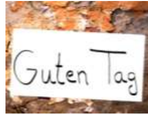
Nous savons dire «bonjour» en allemand

Nous apprenons la chanson « Drei Chinesen mit dem Kontrabass » https://www.youtube.com/watch?v=PmensQUjfas