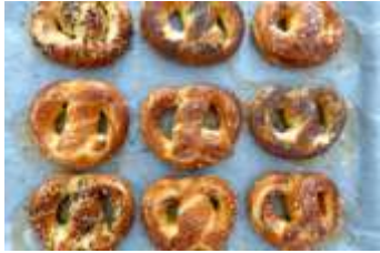
Nous mangeons des bretzels