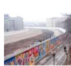
Nous découvrons qu'il y avait un mur pour séparer le pays dans la ville de Berlin, maintenant il y a la porte de Brandebourg