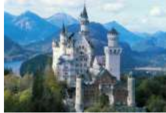
Nous voyons le château de la Belle au bois dormant