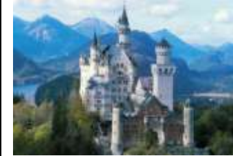
Nous voyons le château de la Belle au bois dormant