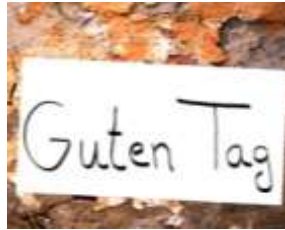
Nous savons dire «bonjour» en allemand