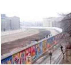
Nous découvrons qu'il y avait un mur pour séparer le pays dans la ville de Berlin, maintenant il y a la porte de Brandebourg