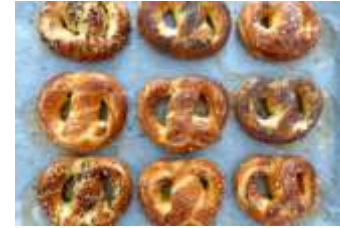
Nous mangeons des bretzels