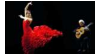
Nous dansons le flamenco