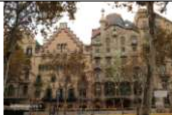
Nous sommes surpris de voir les constructions bizarres