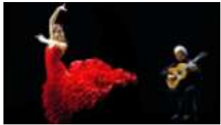
Nous dansons le flamenco