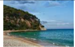
Nous rêvons de vacances