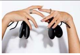
Nous jouons des castagnettes