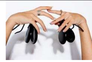
Nous jouons des castagnettes