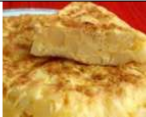
Nous mangeons « espagnol » : tortilla, gaspacho et melon