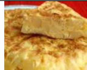
Nous mangeons « espagnol » : tortilla, gaspacho et melon