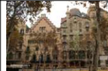
Nous sommes surpris de voir les constructions bizarres