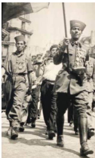
Libération de Paris, Militaires tunisiens de la Légion étrangère, photo de Jean Séeberger, Août 1944 © Succession Séeberger, Dist. RMN-Grand Palais, Musée Carnavalet - Histoire de Paris

Pendant la guerre de 1914-1918, des centaines de milliers de personnes seront recrutées de force dans les colonies pour devenir soldats ou pour travailler dans les usines. Après-guerre de nombreux migrants venus d'Europe arrivent en France pour la reconstruction du pays. En 1931, la France est le plus grand pays d'immigration d'Europe avec 2,7 millions d'étrangers et d'étrangères, soit 7 % de la population, mais la crise économique de 1929 et le chômage vont dégra-