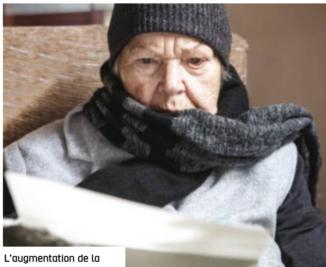
L'augmentation de la pension moyenne ralentit depuis 2014.

Son effet sur l'évolution de la pension moyenne est essentiellement porté par les retraité·es « sortant·es », + 0,9 % sur la période 2005-2020 contre + 0,04 % pour les « entrant·es ». « En d'autres termes, précise le COR, par rapport à la pension moyenne, les retraités "sortants" ont des pensions bien plus faibles alors que les nouveaux retraités n'ont que des pensions légèrement plus élevées. » C'est le flux