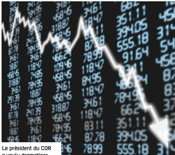
Le président du COR a voulu dramatiser la situation.

L'ex-Première ministre voulait faire étudier par le Conseil d'orientation des retraites (COR) dès mai 2023 « la nécessité d'une adaptation des droits familiaux et conjugaux » au regard des évolutions en termes d'emploi des femmes. Sujet explosif. L'attaque faite en 2003 aux femmes fonctionnaires avec la suppression de la bonification pour enfants va mécaniquement et fortement diminuer la pension des femmes dans les prochaines années. Si cette décision inique ne se traduit pas encore dans les montants liquidés par des femmes ayant accouché avant 2004, le gouvernement a pointé aussi, comme la Cour des comptes, les femmes du régime général pour leurs huit trimestres de majoration de durée d'assurance trop importants à leurs yeux. Pourtant ils ne permettent pas de compenser les inégalités de fait subies par les mères tout au long de leur vie professionnelle.