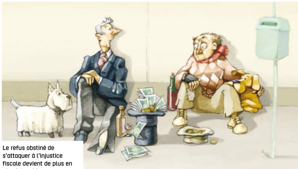
Le refus obstiné de s'attaquer à l'injustice fiscale devient de plus en plus intenable.

Pourtant, le gouvernement ne trouve rien de mieux que de s'en prendre aux plus pauvres et à ceux qui ont le moins de protection.