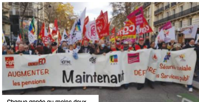
Chaque année au moins deux mobilisations sont organisées par le G9, avec intersyndicales.