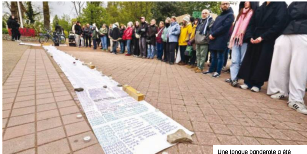
Une longue banderole a été déployée devant le parc Richelieu répertoriant tous les migrants décédés depuis 1990.

Les migrants sont accusés de vouloir venir profiter du système protecteur de la France (même si ce n'est pas leur destination privilégiée) et de ses allocations « généreuses » : RSA, allocations chômage, aides au logement. S'il y a une surreprésentation des immigrés extra-européens dans les bénéficiaires d'aides, ces immigrés cotisent, mais sont aussi exclus du marché du travail en raison de leur situation professionnelle et des discriminations dont elles et ils sont victimes : faible qua-