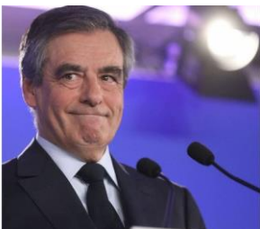
F. Fillon, 2016 devant le Medef

« il ne faut pas faire croire aux Français que cela va régler le problème des retraites [...] le système par points permet, chaque année, de baisser la valeur des points et donc de diminuer le niveau des pensions ».