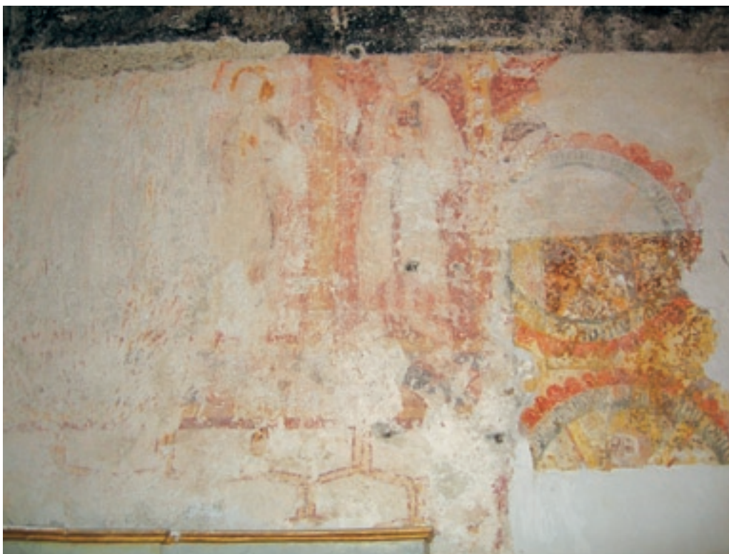
CHASSIGNELLES, ÉGLISE SAINT-JEAN-BAPTISTE, CHŒUR, MUR SUD : DEUX APÔTRES EN PROCESSION AVEC DÉCOR ORNEMENTAL ET SUPERPOSITION DE DEUX APÔTRES EN MÉDAILLON.