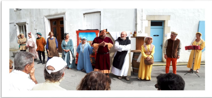
Juste en face des Romanes tribales.

Le dimanche 22 avril , les rues de Mornac sont envahies par les touristes. La manifestation est lancée sur le port où les Graines de Saltimbanque appellent les gens à les suivre vers la ville haute où leur "tréteau" est dressé, près des Halles.