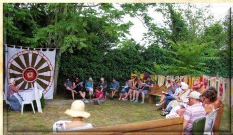
Breuillet, Goûter-Conté 2017

Après l'exposé, fin du parcours. C'est le lendemain de la noce, les amis et les parents des nouveaux mariés sont encore là. On plante le pinier. On dressera aussi le portrait de l'abbaye proche et de son rôle local.