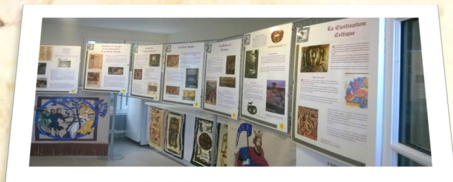
Mornac, exposition 2017

du 21 au 26 mai : Exposition Salle Saint Étienne