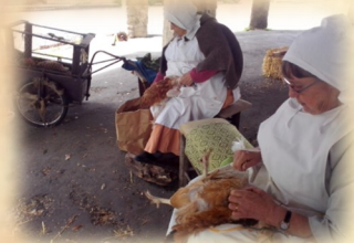
La Poule au pot

Et animations sous les halles : artisans, stands, auteure de medieval fantasy, etc.