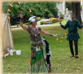
Les Romanes Tribales à Vaux en 2017

14 h 30 les Romanes Tribales planteront leurs tentes devant l'église et le jardin médiéval*.