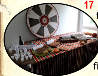
Dégustation Mornac 2017

17 h goûter conté, dans la salle de réception au-dessus du restaurant scolaire : après avoir présenté le mariage médiéval (partie commune à tous les sites), 1ère étape du parcours des deux tourtereaux : la rencontre, les fiançailles et le projet de vie. Selon le principe désormais bien connu, la causerie se finira par une dégustation.