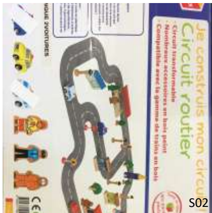
Je construis mon circuit! Circuit routier