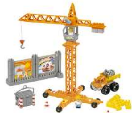
Chantier Gruie Ecoiffier