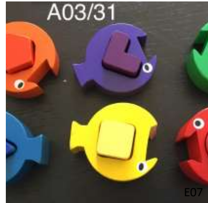
Poissons avec forme