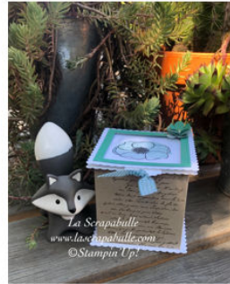
Boîte à ouverture coulissante