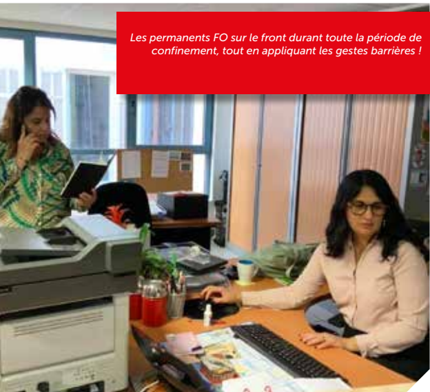
Les permanents FO sur le front durant toute la période de confinement, tout en appliquant les gestes barrières !

pour les Territoriaux de la ville de Marseille et de la métropole Aix-Marseille-Provence