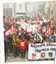
Forte mobilisation des salariés précoces

« L'INEC (FNAD), l'unité de FO est essentielle - et le gouvernement a voulu essayer de diviser les travailleurs et les générations, la force de la mobilisation, c'est de rassembler tous les salariés, en général - et la bataille est engagée avec tous les secteurs comme la liquidation de l'ensemble des régimes. »