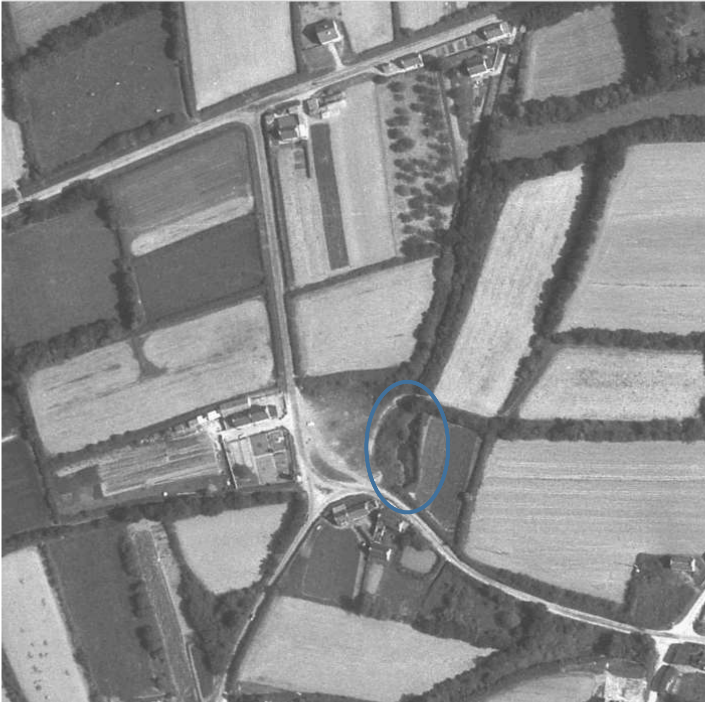
Photo Aérienne du 21 juin 1974

https://remonterletemps.ign.fr/telecharger/?lon=-3.084757&lat=48.744724&z=14&layer=pva&mission