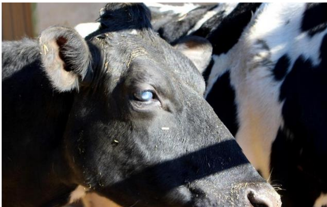
Certaines vaches subissent ce bleuissement des yeux depuis l'implantation du relais.