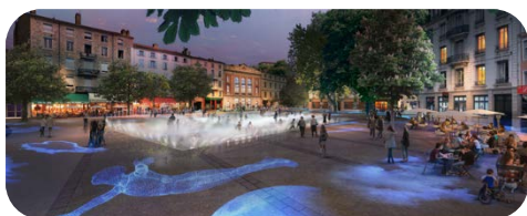
RÉAMÉNAGEMENT DES ÉQUIPES SUR AVIGNON