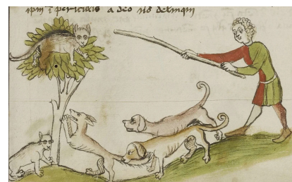
Enluminure du Moyen - Âge

Cependant, les chats ont su s'imposer dans nos foyers. Au fil des ans, de plus en plus de races sont apparues, créant une diversité de pelage, de physique et de caractère. Toutefois, certaines races sont restées sauvages et vivent dans les forêts ou les montagnes telles que le chat sauvage et le chat forestier.