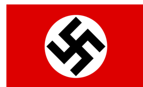
Drapeau du IIIe Reich allemand (1935-1945)