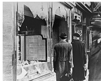
Magasin juif détruit

***Jeunesses Hitlériennes : jeunes entraînés par Hitler pour devenir de futur SS ou soldats.