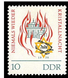
Timbre de la République Démocratique Allemande pour se commémorer les Juifs morts lors de la Nuit de Cristal