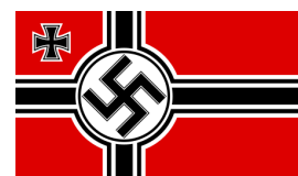
Pavillon de guerre et maritime du IIIe Reich (1938-1945)