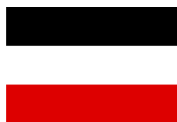
Drapeau de la République de Weimar, puis co-drapeau du IIIe Reich (1922-1935)

La deuxième loi stipule que certaines personnes peuvent jouir de la « Nationalité du Reich ». Seules les personnes apparentées allemandes et possédant du sang allemand sont autorisées à détenir des droits civiques et politiques.