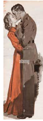
« Couple allemand » 1940

L a troisième loi traite de « l'honneur et de la protection du sang allemand ». Aucune personne juive n'a le droit de se marier avec une personne allemande, c'est à dire que les Juifs allemands ne pouvaient se marier qu'entre eux. De plus, les magnats juifs n'avaient pas le droit d'engager des domestiques allemands. Ils n'avaient pas non plus le droit d'arborez les couleurs du Reich.