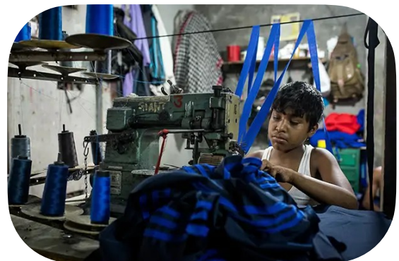
Enfant en train de travailler

*multinationale : qui a des activités dans plusieurs pays.