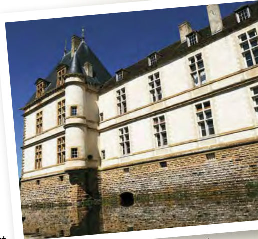
Château de Cormatin.