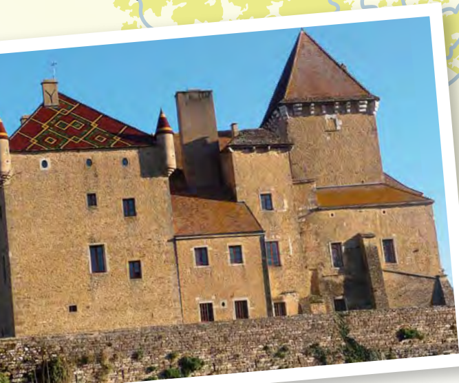
Château de Pierreclos.