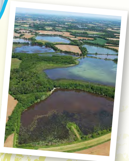
Étangs de la Dombes.