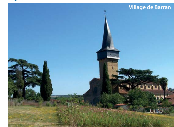
Village de Barran

Auch, Montesquiou, Bassoues, Plaisance, Marciac, Mirande