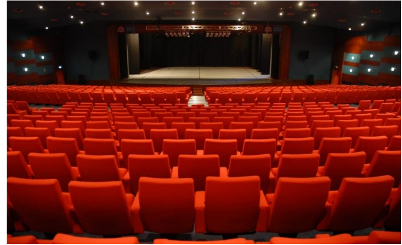
SALLE DE SPECTACLE