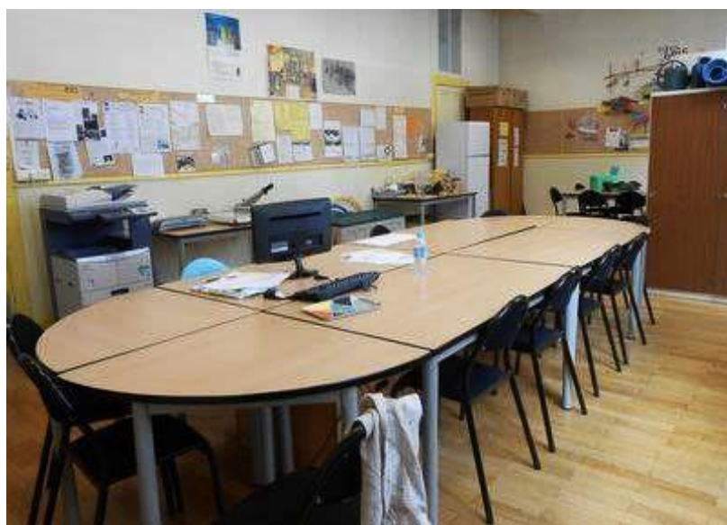
SALLE DES MAÎTRES