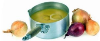
SOUPE À L'OGNON