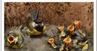
MÉSANGE ET SES PETITS