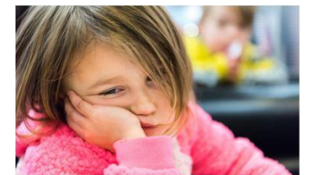
AVOIR L'AIR ÉPUISÉ