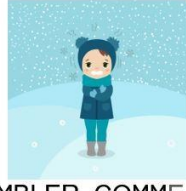
TREMBLER COMME UNE FEUILLE