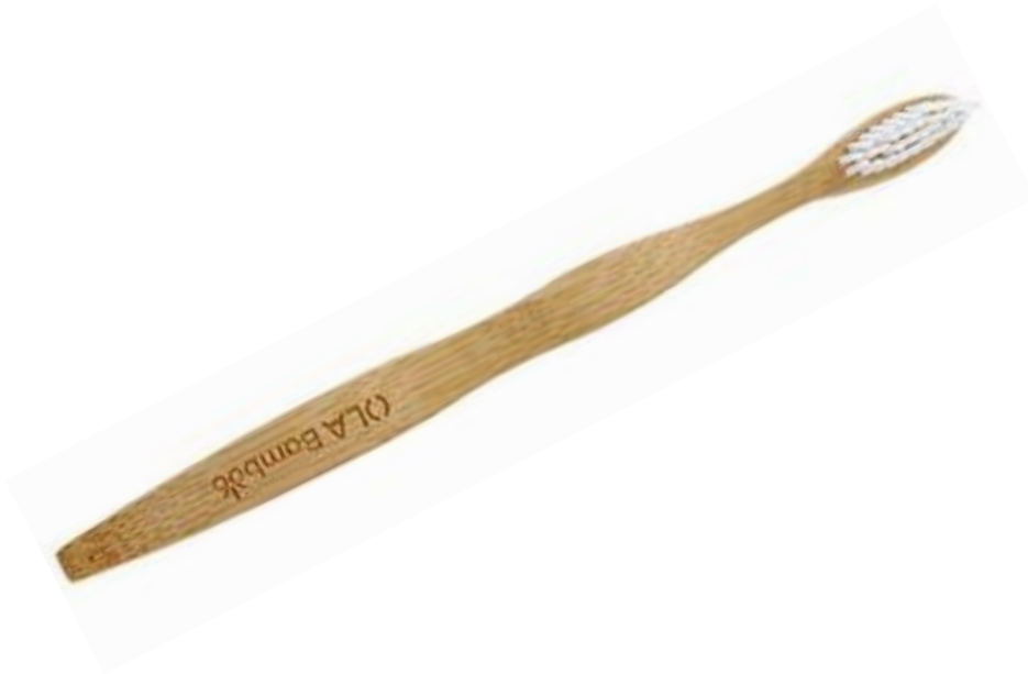
BROSSE À DENTS