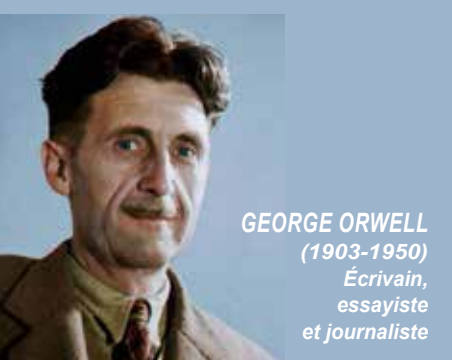
GEORGE ORWELL (1903-1950) Écrivain, essayiste et journaliste

Édito entièrement écrit par un humain, avec les défauts qui vont avec....