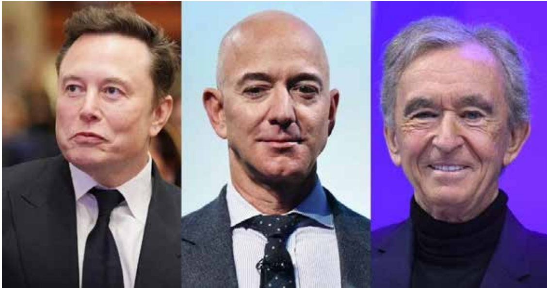
Elon Musk, Jeff Bezos et Bernard Arnault, considérés, en 2024, comme les trois hommes les plus riches du monde.

Des hyper-riches toujours plus riches. L'an dernier "la fortune des milliardaires a augmenté de 2 000 milliards de dollars, un rythme trois fois plus rapide qu'en 2023" , indique le récent rapport de l'Oxfam sur les « Inégalités mondiales », publié le 20 janvier, date de l'ouverture en Suisse du forum annuel mondial de Davos réunissant les grands acteurs économiques de la planète, dont de richissimes P-DG. En France, depuis 2019, la fortune des milliardaires "a augmenté de plus de 24 milliards d'euros au total, soit 13 millions d'euros par jour" , indique le rapport. Clin d'œil à l'actualité budgétaire : "10 % de la fortune cumulée des milliardaires français suffirait pour atteindre l'objectif de 50 milliards d'euros d'économies recherché actuellement pour le budget 2025."