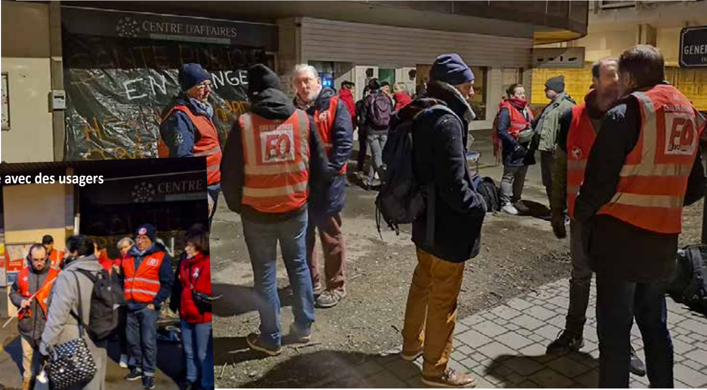
Échange avec des usagers

Car dissolution ou pas du gouvernement, la ligne reste la même pour le pouvoir : suppressions de lits d'hôpitaux, suppressions de postes, suppressions de moyens et une catastrophe programmée pour les personnels et les usagers !