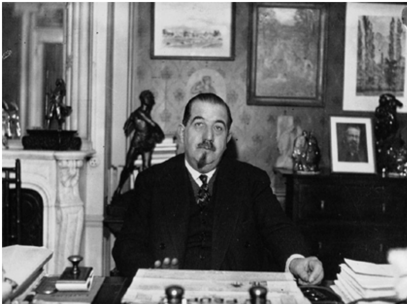
Léon Jouhaux, président de la CGT (1933).

En 1913 à Zürich, apparaît la FSI (Fédération syndicale internationale) qui se transforme en FSM (Fédération syndicale mondiale) à Paris en septembre 1945. Trois tendances s'y opposent : la communiste avec les nouveaux syndicats de l'Europe de l'Est et la majorité de la CGT en voie de stalinisation ; la travailliste avec les Britanniques et les Scandinaves ; la centriste avec le CIO américain, les syndicats chinois, la CGT italienne et la minorité de la CGT française derrière Léon Jouhaux.