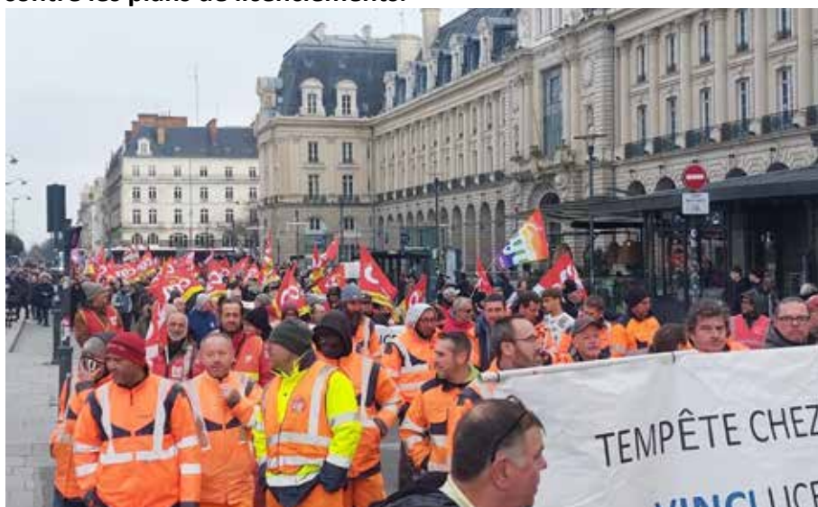
Comme la semaine dernière, les salariés d'Axiens, société située à Pacé et filiale de Vinci Energies, ont pris la tête de cortège.

Entre 520, selon la police, et 600 personnes, selon les syndicats, ont pris part à la manifestation de ce jeudi 12 décembre à Rennes contre les plans de licenciements.