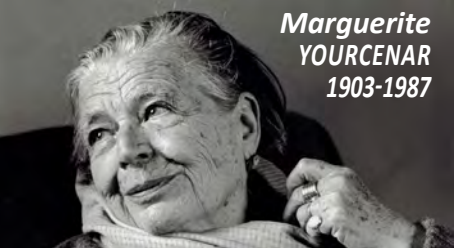
Marguerite YOURCENAR 1903-1987