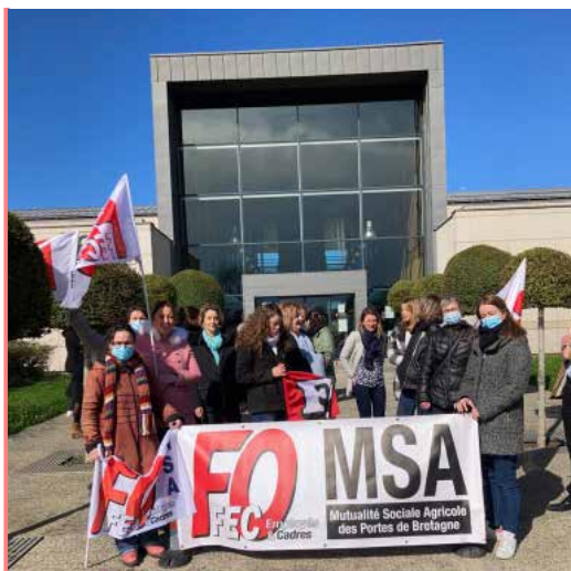
Nos camarades FO de la MSA ont débrayé ce 17 Mars pour leur salaire