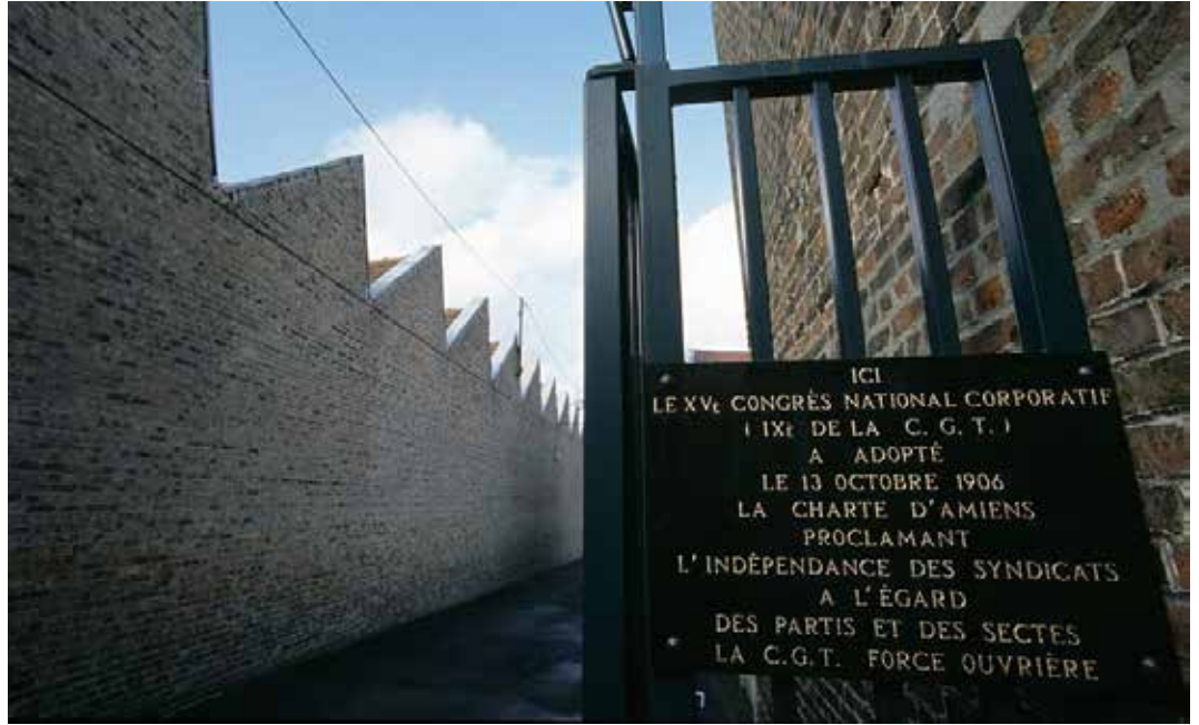
Plaque commémorant l'adoption de la charte d'Amiens à l'entrée de l'école publique du Faubourg de Noyon, rue Rigollot à Amiens.

Votée le 13 octobre 1906 lors du IX e congrès de la CGT, la Charte d'Amiens est une véritable déclaration des droits du syndicaliste et du citoyen. Elle proclame hautement l'indépendance du syndicat par rapport à "l'État oppresseur", au "patronat exploiteur" et à l'ensemble des partis politiques. Pour Victor Griffuelhes (1874-1923), secrétaire général de la CGT de 1901 à 1909 : " Le syndicalisme est le mouvement de la classe ouvrière qui veut parvenir à la pleine possession de ses droits sur l'usine et sur l'atelier. "