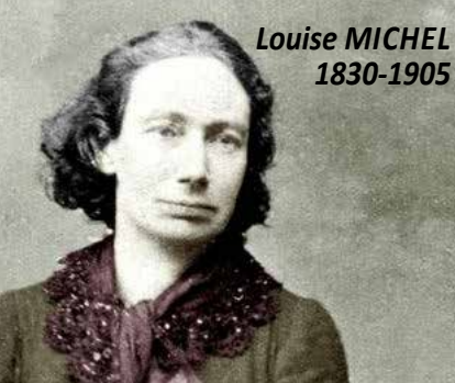
Louise MICHEL 1830-1905

"Il faut bien que la vérité monte des profondeurs du peuple, puisque d'en haut ne viennent que des mensonges."