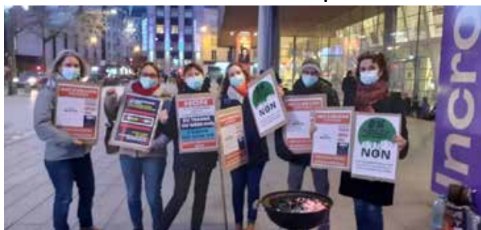
Durant les fêtes de fin d'année, des agents des bibliothèques en grève ont affiché leur détermination devant les Champs libres.

L'année 2021 aura été marquée par le bras de fer entre la Ville de Rennes et une partie de ses agents, au sujet des repos compensateurs. Selon le syndicat Force Ouvrière, le mouvement a toutes les chances de se poursuivre en 2022