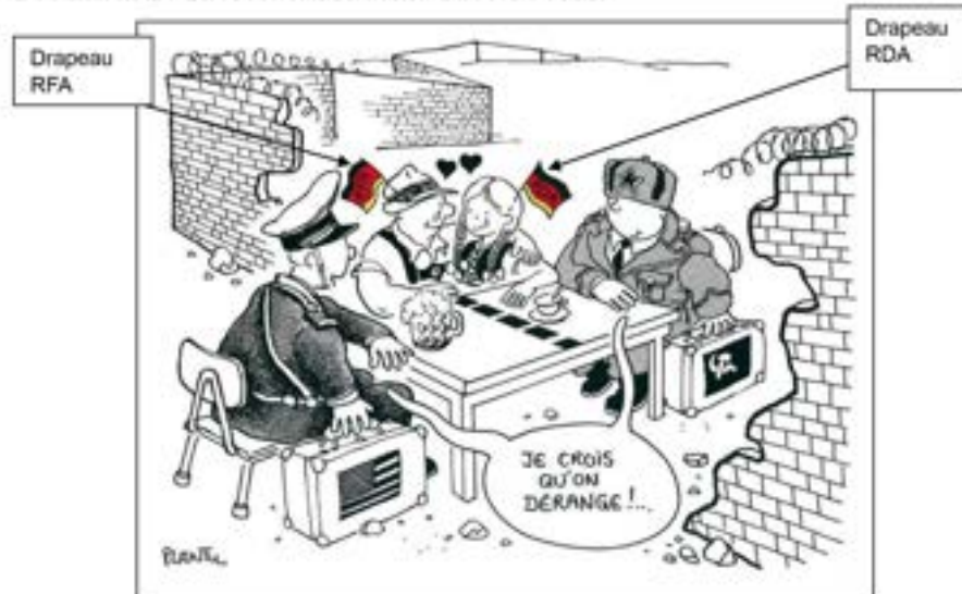
Document 2 : La réconciliation allemande en 1990.

Source : Plantu, dessin de presse paru dans Le Monde , le 2 février 1990.