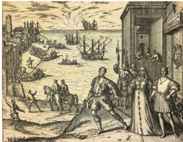
L'adieu de Christophe Colomb aux souverains espagnols Isabelle de Castille et Ferdinand d'Aragon, Théodore de Bry, Grands voyages, America pars quarta , 1592, gravure.

1 Grenade : ville espagnole, au sud-est de l'Andalousie. 2 Palos : ville côtière espagnole d'où part Colomb en août 1492. 3 J'armai : j'équipai. 4 Dudit : celui qui a été mentionné avant. 5 Pourvu : muni, équipé. 6 Subsistances : nourriture. 7 S'acquitter de : accomplir un engagement. 8 Ambassade : représentation officielle d'un chef d'État à l'étranger.