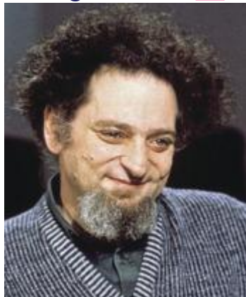
Louis Monier/Bridgeman Images

Écrivain français, membre de l'OuLiPo (OUvroir de Littérature POtentielle). Il est l'auteur de Je me souviens (1978), un recueil de souvenirs.