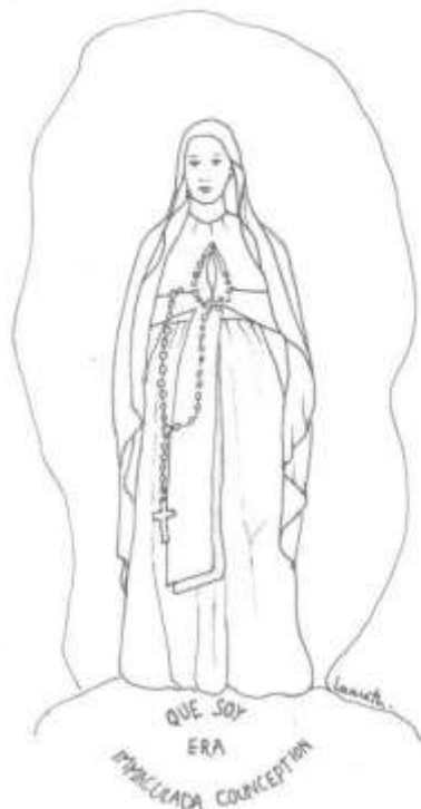
Notre Dame de Lourdes

Béni sois-tu, Dieu notre Père, D'avoir créé Marie si belle Et de nous l'avoir donnée pour Mère Au pied de la Croix de Jésus. Béni sois-tu de nous avoir appelés, Comme Bernadette, À voir Marie dans ta lumière Et à boire à la source de ton cœur. Marie, tu connais la misère et le péché De nos vies et de la vie du monde. Nous voulons nous confier à toi aujourd'hui Totalement et sans réserve ; De toi nous renaîtrons chaque jour Par la puissance de l'Esprit, Nous vivons de la vie du Seigneur Apprends-nous le oui de ton cœur.