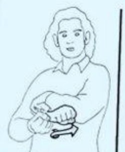
12 LA SEMAINE

Les signes pour les mois varient beaucoup selon les régions. Vérifiez auprès des sourds qui vous entourent.