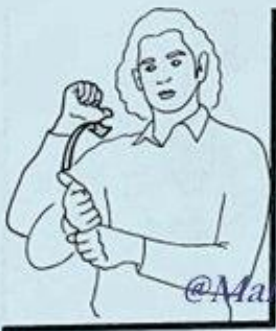
10 L'ANNÉE DERNIÈRE