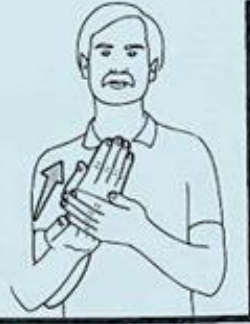
2 le MATIN, la MATINÉE