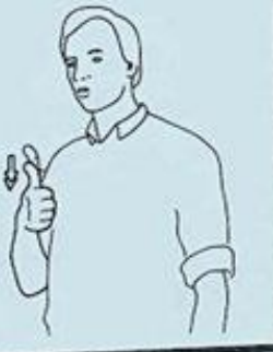
7 UNE HEURE