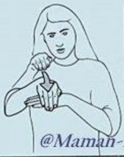
9 le SOIR, la SOIRÉE