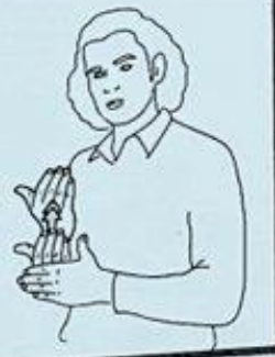
3 CE MATIN