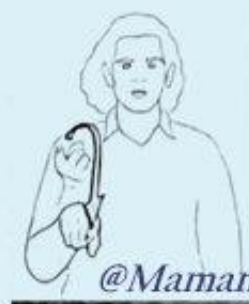
6 un MOIS