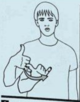
2 un JOUR