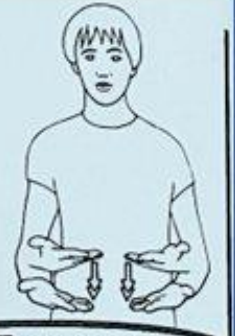
4 AUJOURD'HUI, MAINTENANT