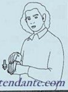
10 CE SOIR