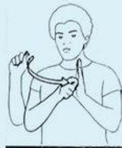
2 une DATE