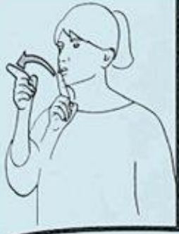
1 un JOUR