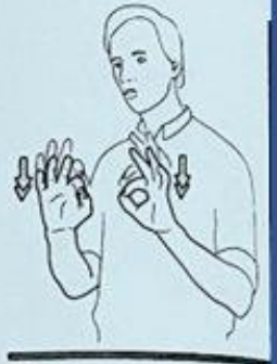
8 DIX HEURES