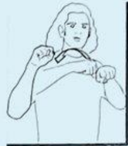
3 un SIÈCLE