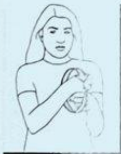
4 une ANNÉE