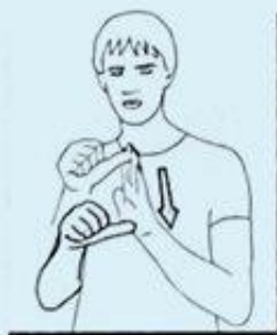
5 un MOIS