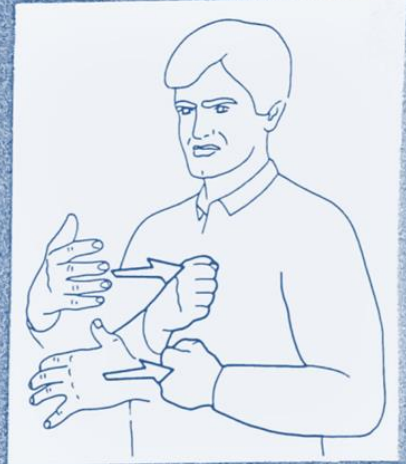
1 246. ACCEPTER (« je veux bien »)