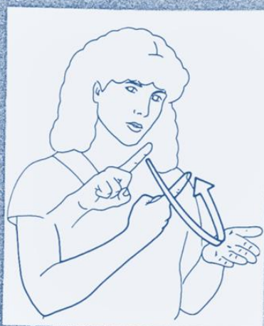
1 257. REFAIRE, RECOMMENCER