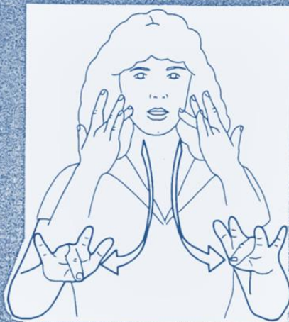
1 248. QUITTER