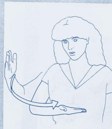
1 243. RECEVOIR