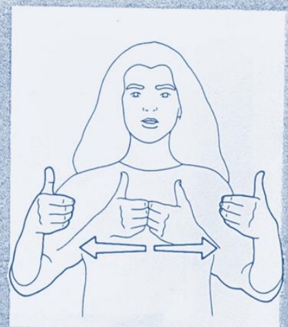
1 270. SEPARER