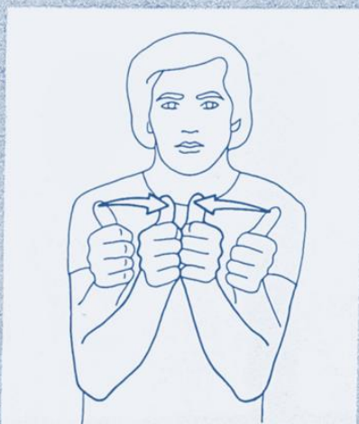
1 268. AVEC, ENSEMBLE