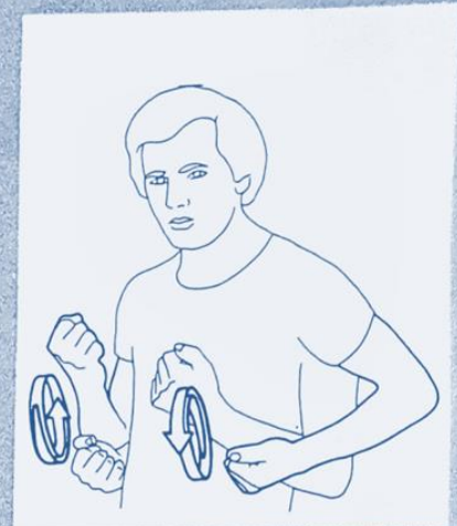
1 264. COURIR