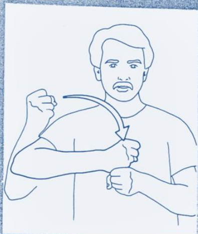
1 247. FONDER, ÉTABLIR, CRÉER