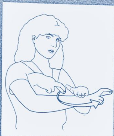
1 256. RECOMMENCER