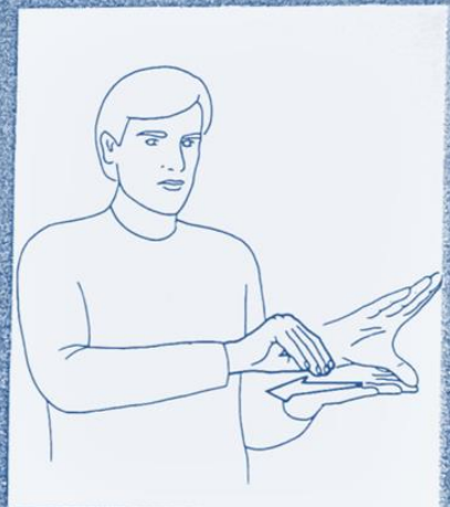
1 249. COPIER, IMITER