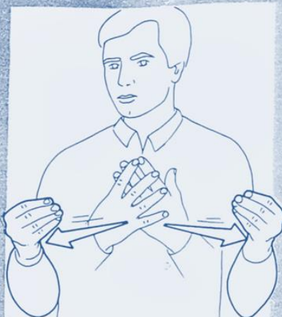
1 236. DISPARAÎTRE