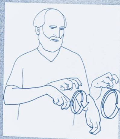
1 261. des TRAVAUX