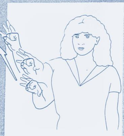
1 267. RATTRAPER, RECUPERER