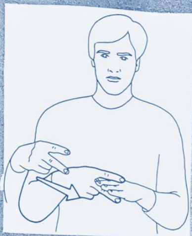
1 253. COMMENCER