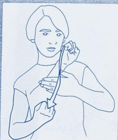
1 241. SE NOYER