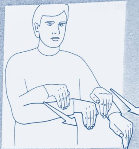
1 255. CONTINUER