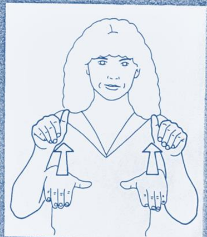
1 252. SE RETIRER