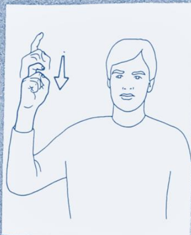
1 254. COMMENCER