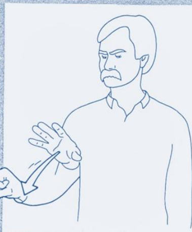
1 266. ATTRAPER