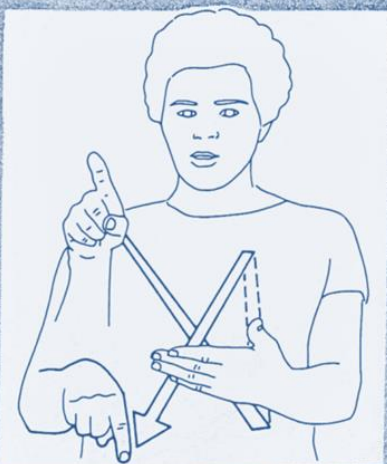
1 250. ANNULER (supprimer)