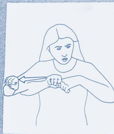
1 258. FAIRE