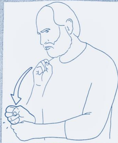
1 263. PUNIR