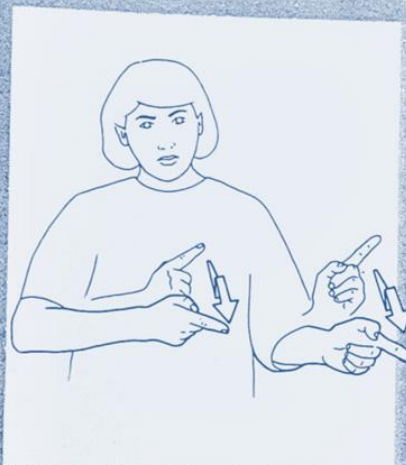
1 238. la GUERRE