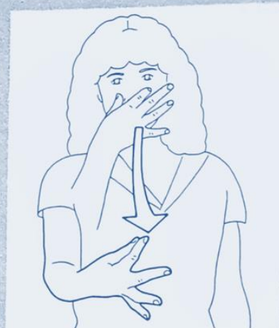
1 237. RATER