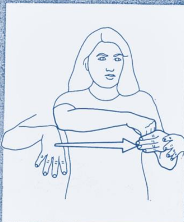
1 251. PARTICIPER, SE JOINDRE À, S'INTÉGRER