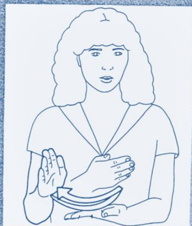
1 259. PRÉPARER