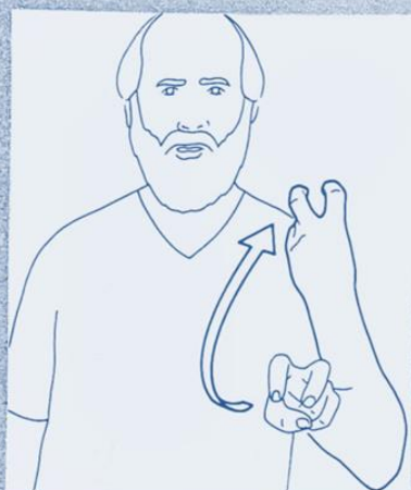
1 239. VOLER (quelque chose)