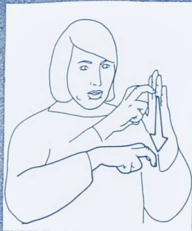
1 245. RÉGRESSER