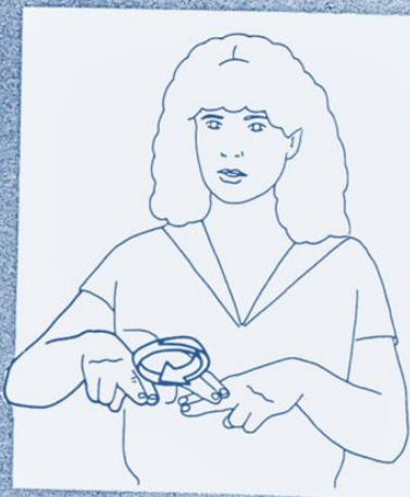
1 260. RÉPARER