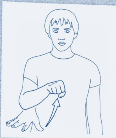
1 265. PRENDRE