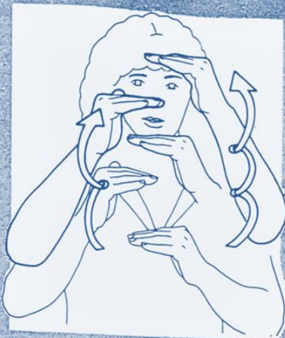
1 244. PROGRESSER