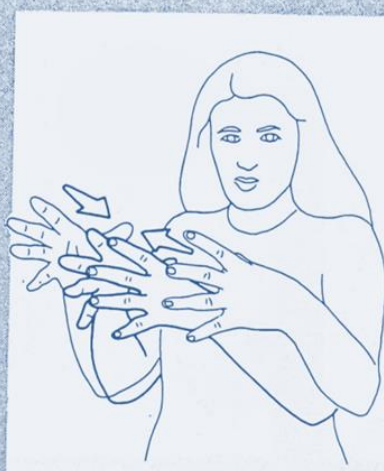
1 269. REUNIR, ENSEMBLE