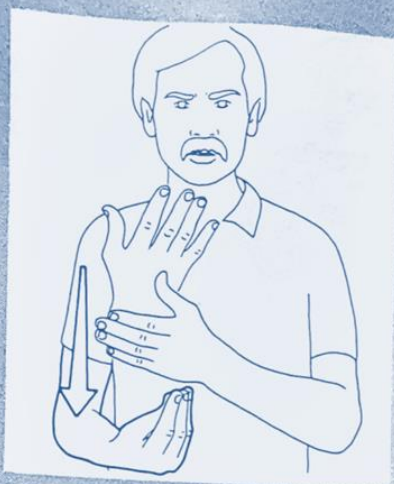
1 235. MANQUER, être ABSENT