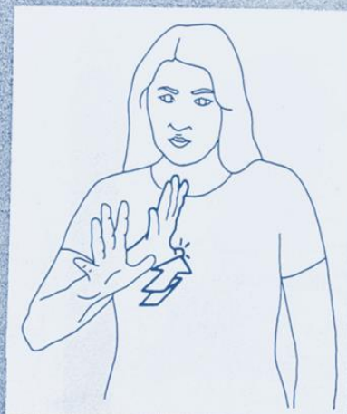
1 242. AVOIR (posséder), IL Y A (exister)