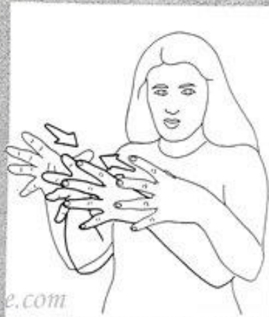
1 269. RÉUNIR, ENSEMBLE