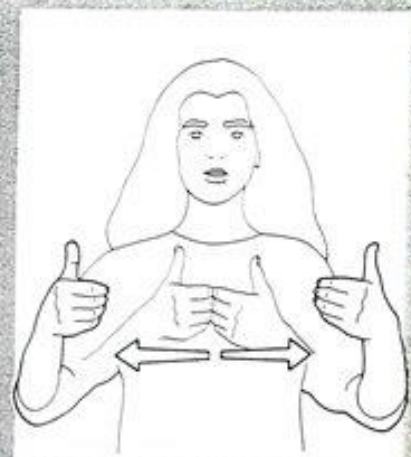
1 270. SEPARER