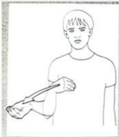
1 214. DONNER