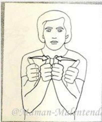
1 268. AVEC, ENSEMBLE