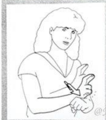
1 234. RÉSERVER