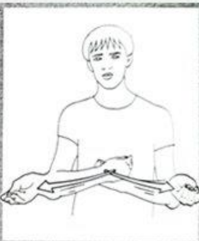
1 215. DISTRIBUER