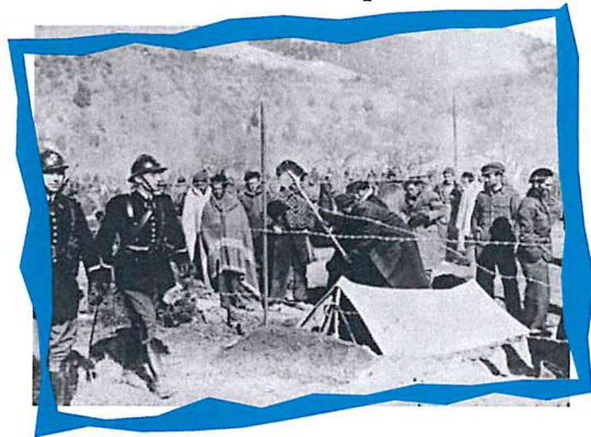
Camp d'Amélie-les-Bains où, à partir de 1939, sont placés sous haute surveillance des combattants républicains espagnols et des brigadistes étrangers.

Lorsqu'en septembre 1939, la France déclare la guerre à l'Allemagne nazie, un grand nombre d'étrangers veulent s'engager au service de l'armée française. D'autres, victimes d'une politique de répression, sont internés dans des camps. Nombreux sont ceux qui rejoignent les rangs de la France libre ou les maquis de la Résistance où ils vont tenir une place très importante.