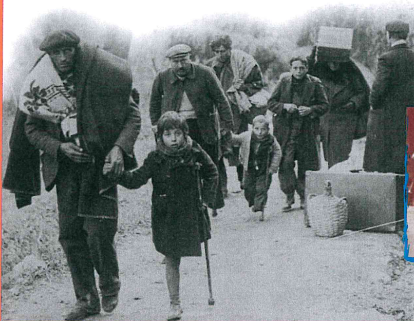
Perpignan 1939. Après la prise de Barcelone par les franquistes, l'exode des Espagnols vers la France s'amplifie (à gauche).