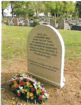
La stèle "Division 40".

Un monument à la mémoire des fusillés du Mont-Valérien a été inauguré le 20 septembre 2003. On y relève le nom des résistants de la MOI fusillés le 21 février 1944.