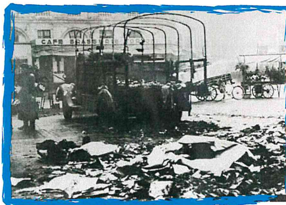
Attentat de la 35e Brigade FTP-MOI contre des convois de transport allemand à Toulouse en février 1943.