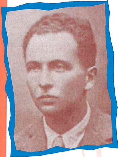
Louis Aragon écrivain, poète français 1897-1982