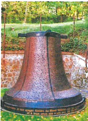
Le monument à la mémoire des fusillés du Mont-Valérien.

Commémoration au cimetière d'Ivry du premier anniversaire de l'exécution du groupe manouchian, 25 février 1945.