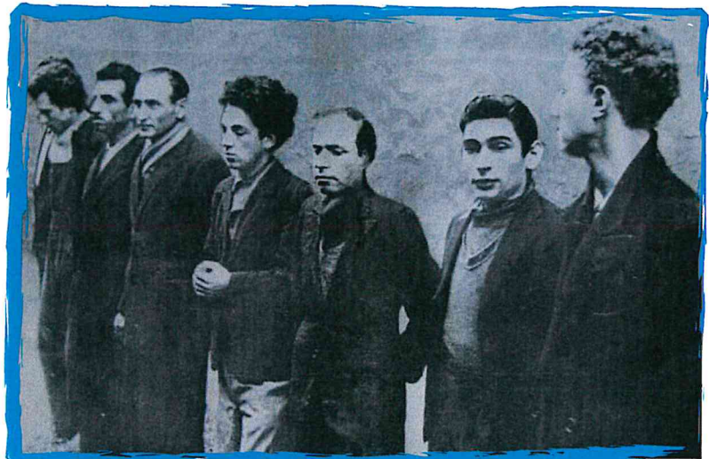
Le groupe Manouchian après son arrestation.