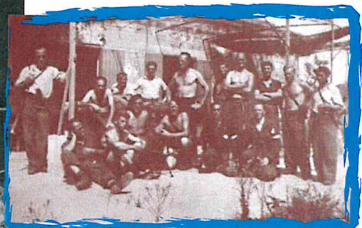
Des antinazis allemands, ayant combattu dans les brigades internationales, dans un maquis de Lozère.