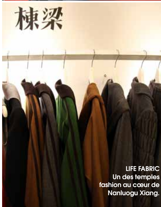
LIFE FABRIC Un des temples fashion au cœur de Nanluogu Xiang.