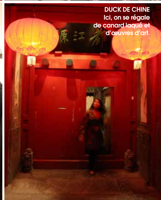
DUCK DE CHINE Ici, on se régale de canard laqué et d'œuvres d'art.