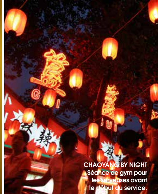
CHAOYANG BY NIGHT Séance de gym pour les serveuses avant le début du service.