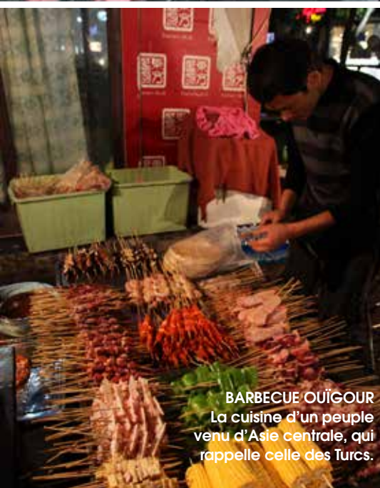
BARBECUE OÛIGOUR La cuisine d'un peuple venu d'Asie centrale, qui rappelle celle des Turcs.