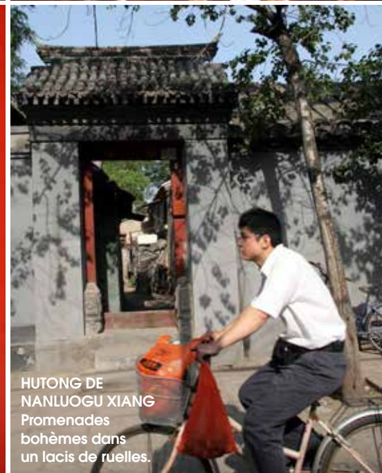
HUTONG DE NANLUOGU XIANG Promenades bohèmes dans un labyrinthe de ruelles.