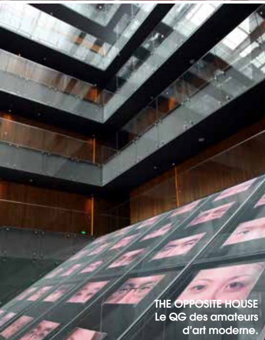
THE OPPOSITE HOUSE Le QG des amateurs d'art moderne.