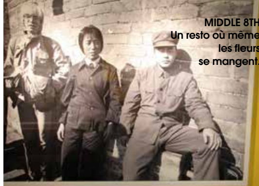
MIDDLE 8TH Un resto où même les fleurs se mangent.