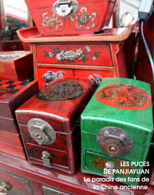
LES PUCES DE PANJIAYUAN Le paradis des fans de la Chine ancienne.