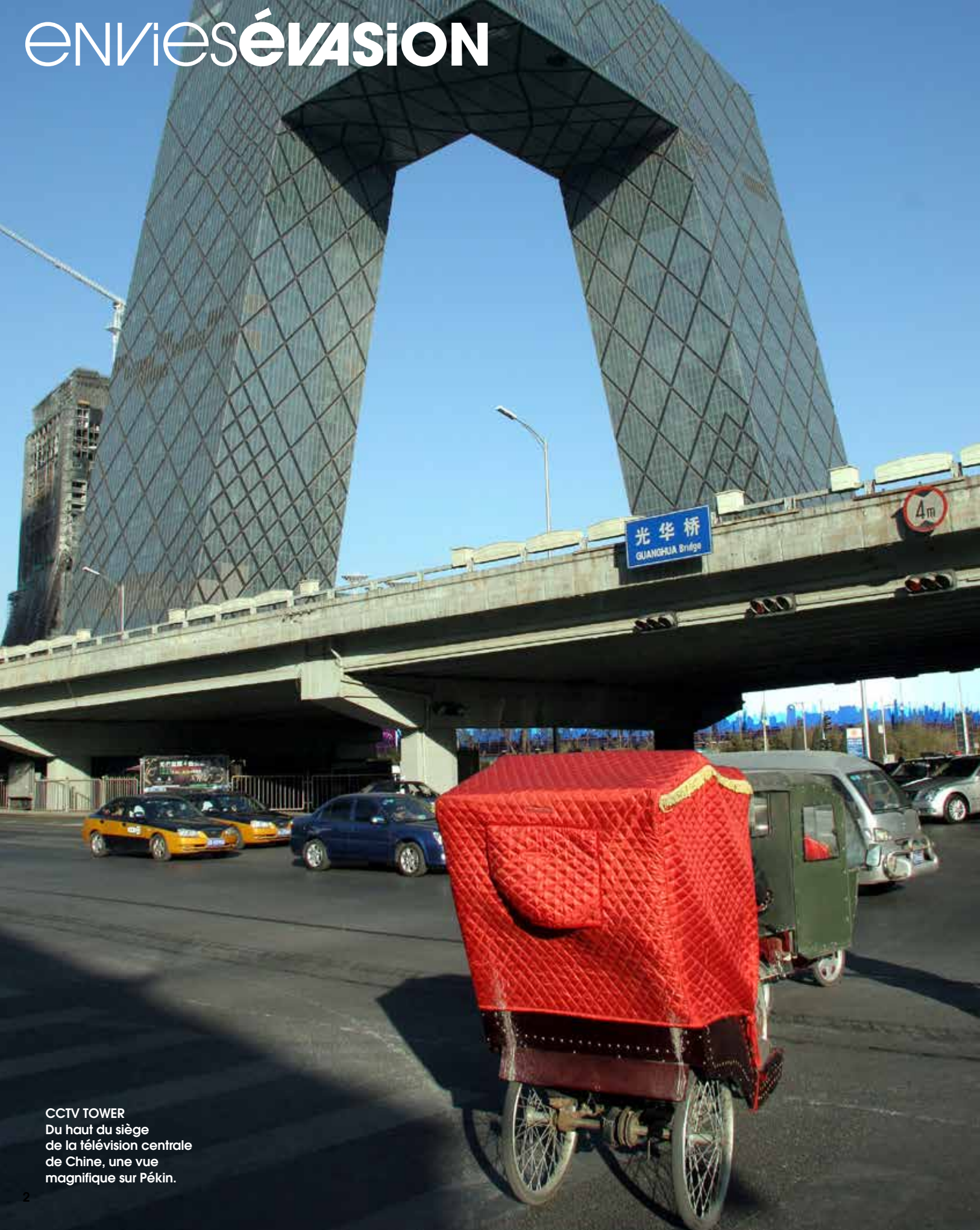
CCTV TOWER Du haut du siège de la télévision centrale de Chine, une vue magnifique sur Pékin.