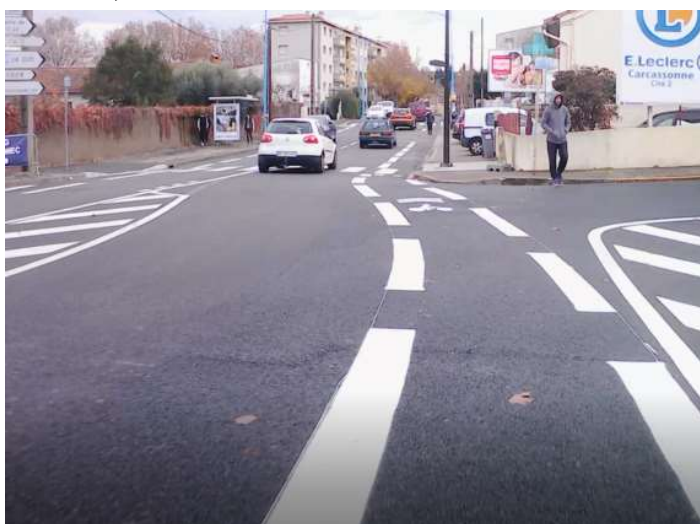
Bd Joliot Curie, niveau stade Domec