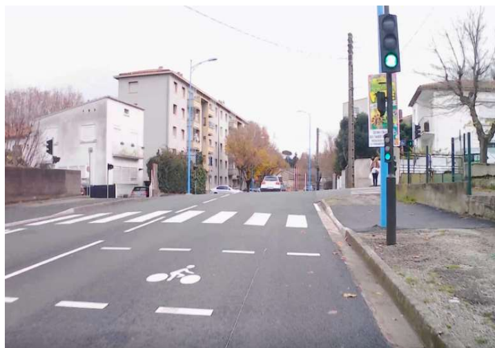
croisement rue Paul Lacombe

a) La bande cyclable réalisée Bd Joliot Curie allant du Pont de l'Avenir au Rond Point Pole employé est satisfaisante : large bande cyclable, dans les 2 sens, sas à vélo au feu avec la rue Paul Lacombe. Ce tronçon est bien sécurisé