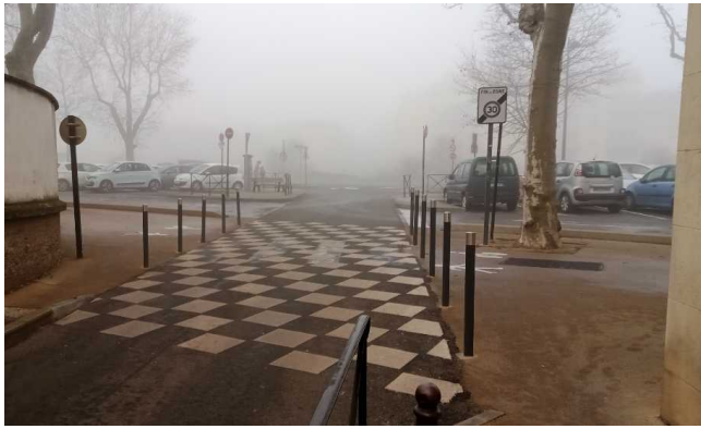
Rue de la liberté/contre allée