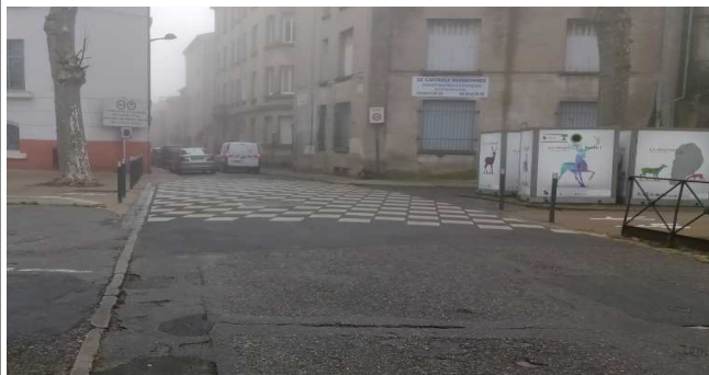
Intersection avec rue Victor Hugo. Le positionnement du panneau 30 km/h laisse à penser que les véhicules peuvent arriver à 50 km/h à partir du Bd de Varsovie