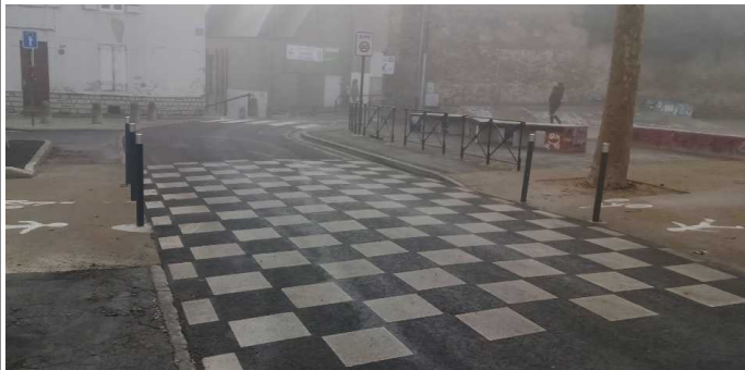
Intersection avec rue des Etudes