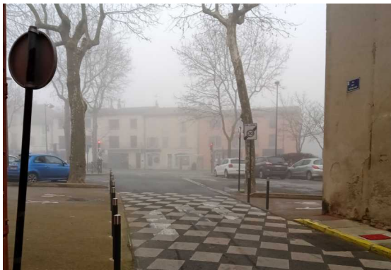
Intersection avec rue de la République : quasiment pas de visibilité pour les vélos/piétons arrivant de droite.