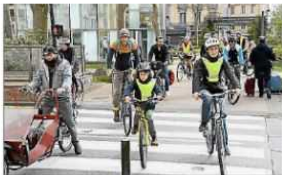
Au départ du square Gambetta.