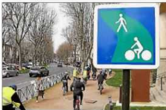
La sécurité des usagers de vélo est pointée du doigt.

liorations constatées et souhaitées en matière de sécurité et de stationnement ». Partie du square Gambetta, la vélorution a ainsi emprunté l'avenue Jean Jaurès, la rue Antoine Marty, le boulevard Joliot Curie, l'avenue Jean Moulin, le boulevard Leclerc puis les rues Jourdanne, Beaumets, Barbacane, Pont Vieux et Calquières, pour une arrivée square Chénier. Une belle balade militante, qui s'inscrit bien sûr dans le sillon de l'enquête menée par l'association dans le cadre du Baromètre national des villes cyclables. Les organisateurs n'ont pas manqué de rappeler que Carcassonne a encore des progrès à faire, occupant la 188 e place sur les 218 villes moyennes du classement.