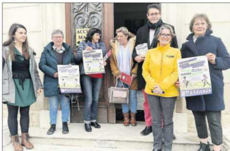
Quelques-uns des partenaires lors de la présentation.

Dimanche encore, de midi jusqu'à 17 h 30, l'association La Roue qui Tourne proposera du conseil sur l'entretien des vélos. Et un parcours vélo pour adulte, afin de « rouler en toute sécurité en milieu urbain ». Le cyclo