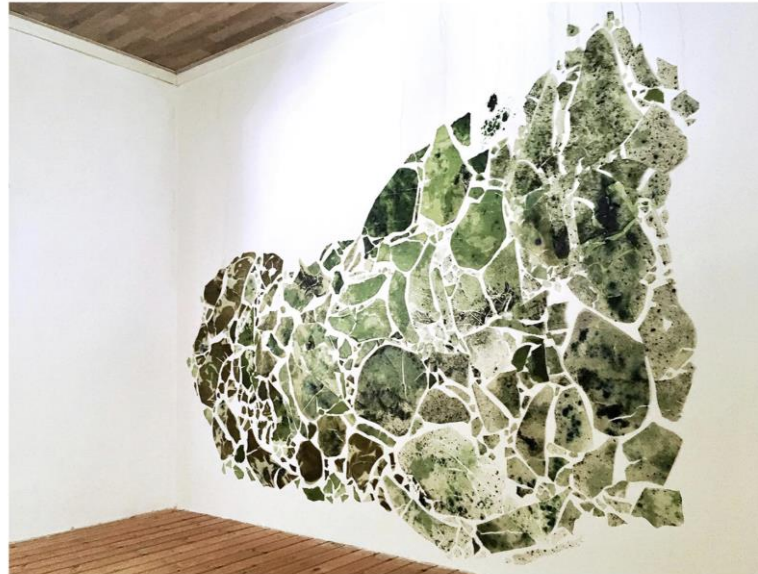
LANDS OF WATER

Agar-agar, glycérine de moutarde, spiruline, pigments naturels, mousse 120 x 100 cm 2020