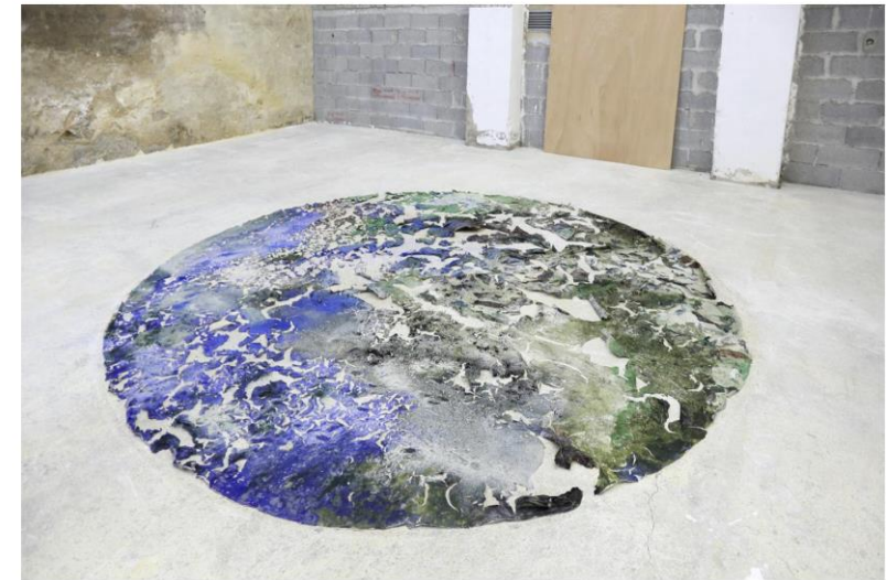
TOP VIEW ( EARTH ARCHIVE)

Agar-agar, spiruline, pigments naturels Installation in-situ, 4 m de diamètre 2020 Exposition de sortie de résidence à Coco Wilton (Marseille) aux côtés des œuvres d'Amardine Capion.