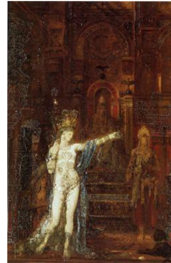
Gustave Moreau, Salomé dansant , 1874, huile sur toile, 92x60 cm, musée Gustave Moreau, Paris

« Je lègue ma maison sise 14, rue de La Rochefoucauld, avec tout ce qu'elle contient : peintures, dessins, cartons, etc., travail de cinquante années, comme aussi ce que renferment dans ladite maison, les anciens appartements occupés jadis par mon père et ma mère, à l'Etat, [...] à cette condition expresse de garder toujours - ce serait mon vœu le plus cher - ou au moins aussi longtemps que possible, cette collection, en lui conservant son caractère d'ensemble qui permette toujours de constater la somme de travail et d'efforts de l'artiste pendant sa vie. » Testament de Gustave Moreau du 10 septembre 1897, extrait